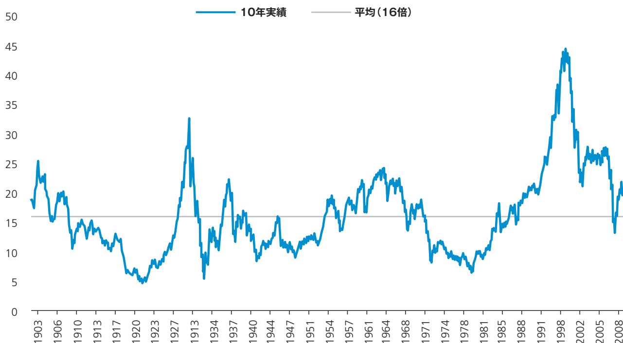
景気循環調整後株価収益率=CAPE (P/E10)